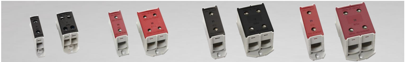
Universalklemmen für DC Anwendungen 50 – 300 mm 2 , 1-, & 2-fach