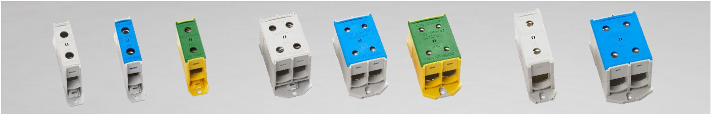
Universalklemmen 16 – 300 mm 2 , 1-, 2- & 3-fach